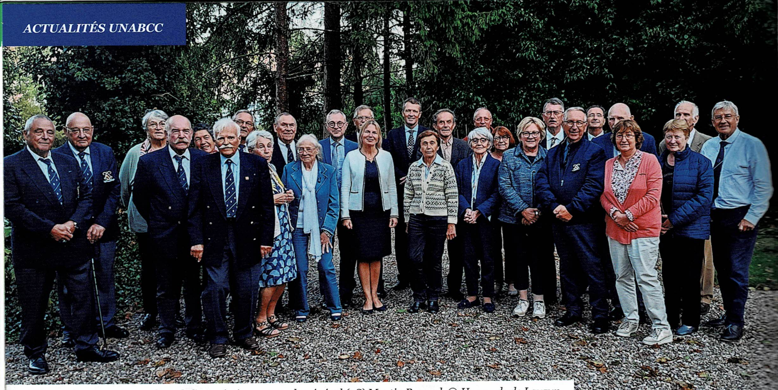
Photo de groupe des membres de l'association autour du général (2S) Martin Renard.